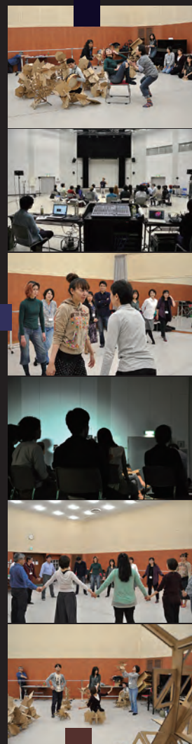
ワークショップ風景