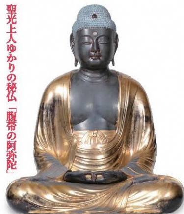
阿彌陀如来坐像 鎌倉時代 福岡・吉祥寺