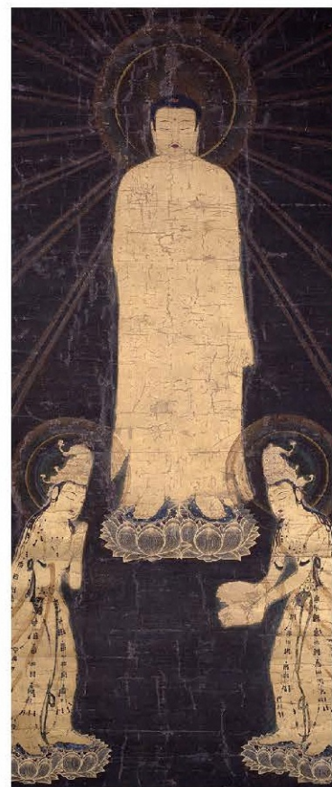
阿彌陀三尊來迎圖 鎌倉時代 福岡・莊嚴寺